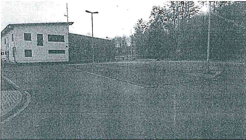
Abbildung: Vorgeschlagener Standort in Wahlscheid